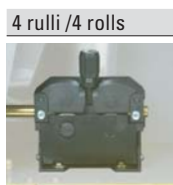
Compact 364 - 410 Compact Syn 3100 - 3600 - 4100