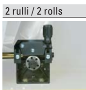
Compact 240M - 270 - 310 - 360